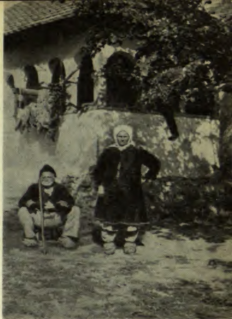
Român din Carpații Timocului în pori național românesc