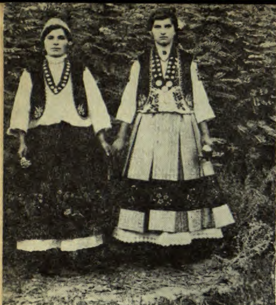
Românce din comuna Corbova, plasa Cladova, județul Craina- Timoc