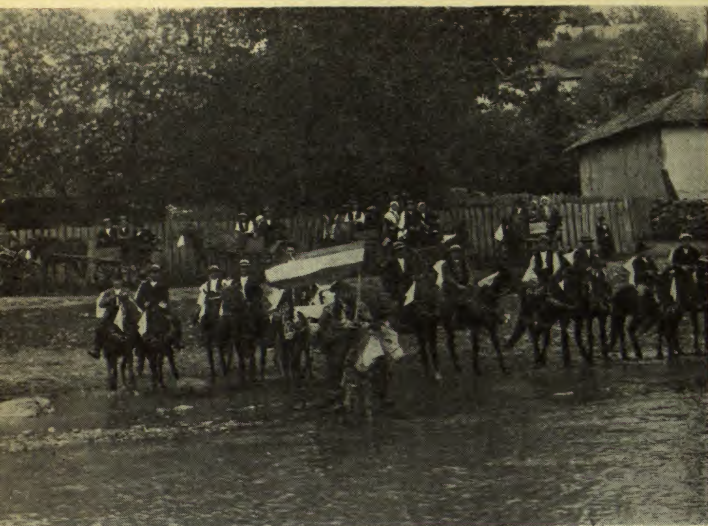
Obicei de nuntă din comuna Bres- tovăţ, plasa Bor, judeţul Timoc