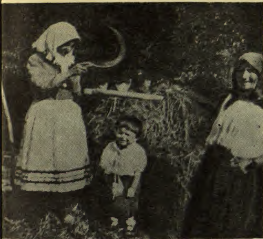
Fetițe timide în târg la Bor