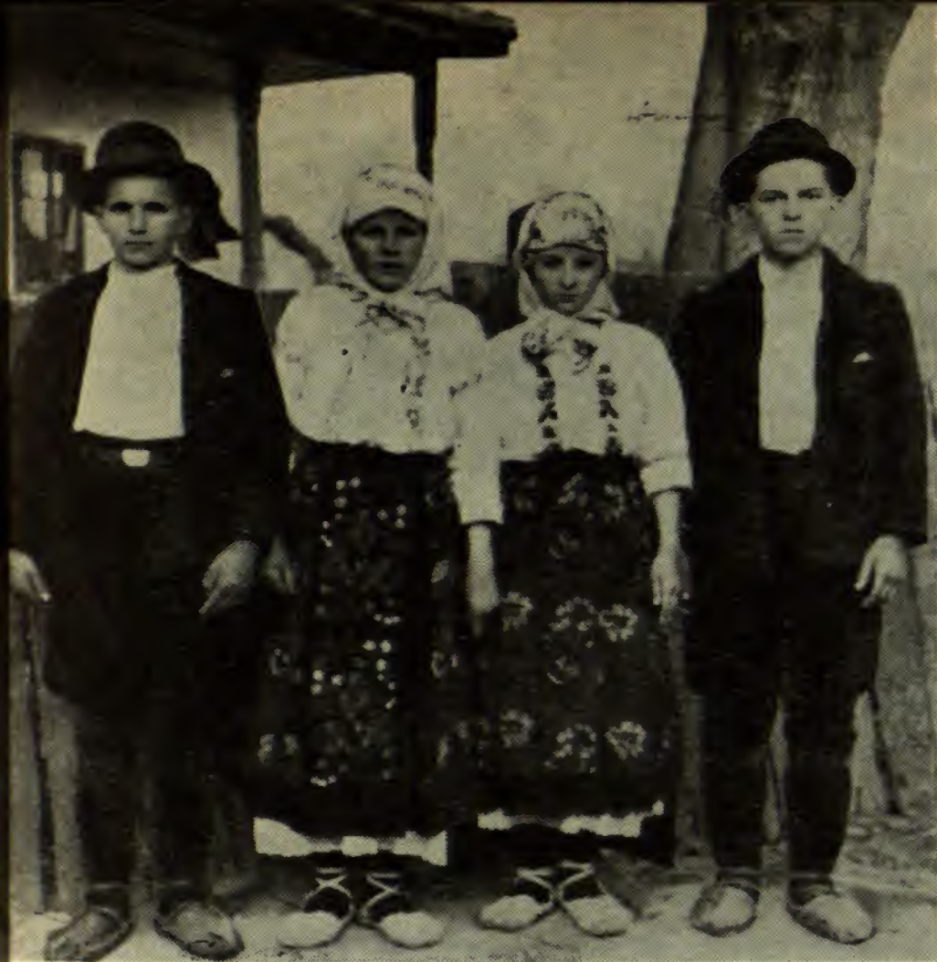
Tineri din comuna Vîrbița-Mare, plasa Cladova, județul Timoc