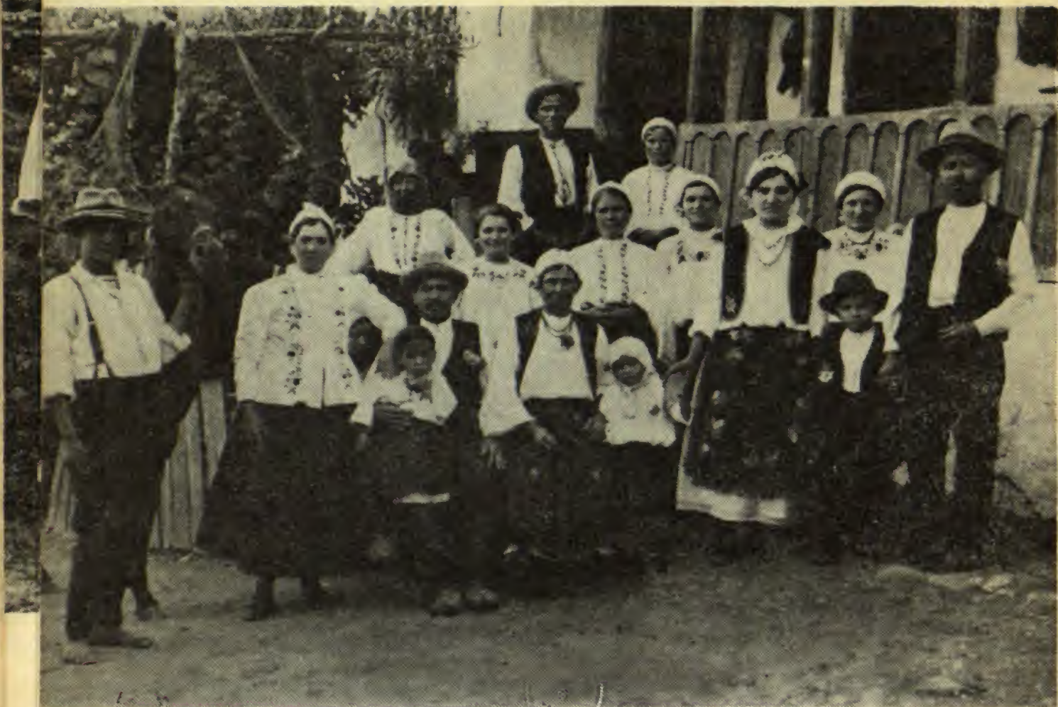
Români din Timoc