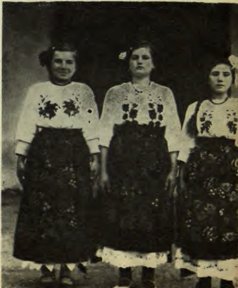
Tinere din comuna Costol (Castello), plasa Cladova, județul Timoc